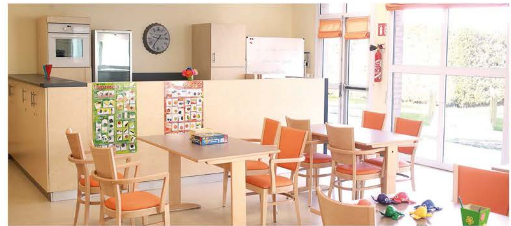
■ La pièce d'activité avec l'espace cuisine