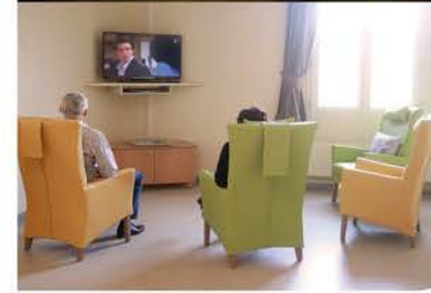
■ Les pièces de repos et de détente