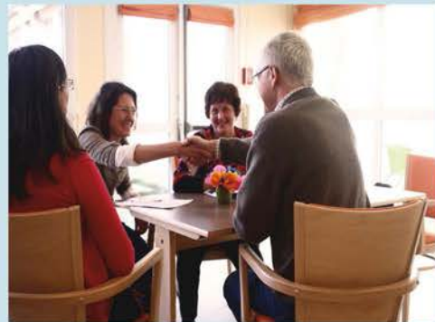
■ Premier rendez-vous à l'accueil de jour

L'accueil de jour Les Feuillantines a pour mission d'accompagner, à la journée, 12 personnes âgées atteintes de la maladie d'Alzheimer ou de pathologies apparentées, dans un cadre agréable et sécurisé.