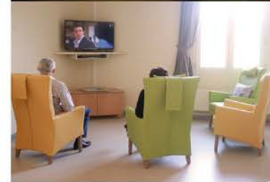
■ Les pièces de repos et de détente