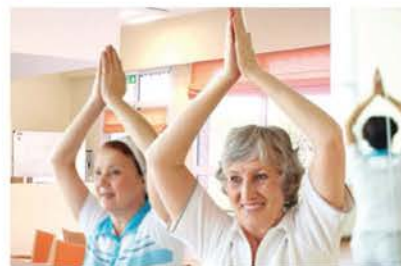
■ Gymnastique douce

■ Une prise en charge financière du prix de journée est possible sous conditions, par le biais de l'Allocation Personnalisée à l'Autonomie (APA).