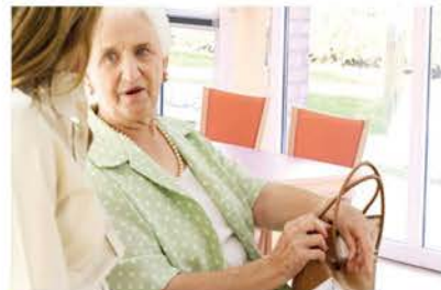
■ l'accueil de jour

■ L'accueil de jour est ouvert du lundi au vendredi, sauf jours fériés, de 9h30 à 17h.