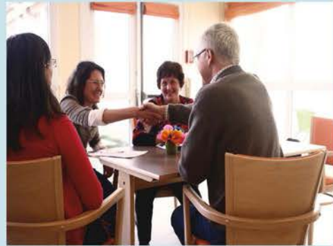
■ Premier rendez-vous à l'accueil de jour

L'accueil de jour Les Feuillantines a pour mission d'accompagner, à la journée, 12 personnes âgées atteintes de la maladie d'Alzheimer ou de pathologies apparentées, dans un cadre agréable et sécurisé.