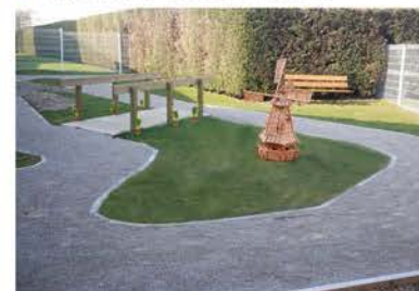
■ Le jardin clos

■ Un accompagnement par une équipe professionnelle, motivée et qualifiée :