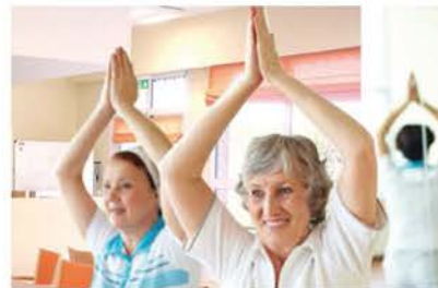
■ Gymnastique douce

■ Une prise en charge financière du prix de journée est possible sous conditions, par le biais de l'Allocation Personnalisée à l'Autonomie (APA).