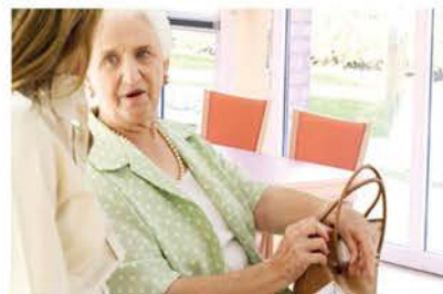
■ l'accueil de jour

■ L'accueil de jour est ouvert du lundi au vendredi, sauf jours fériés, de 9h30 à 17h.